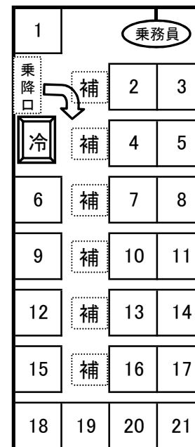
Dタイプ 三菱・ローザ