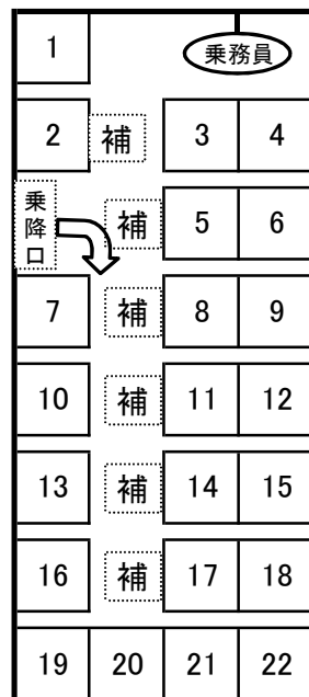
Bタイプ トヨタ・コースター